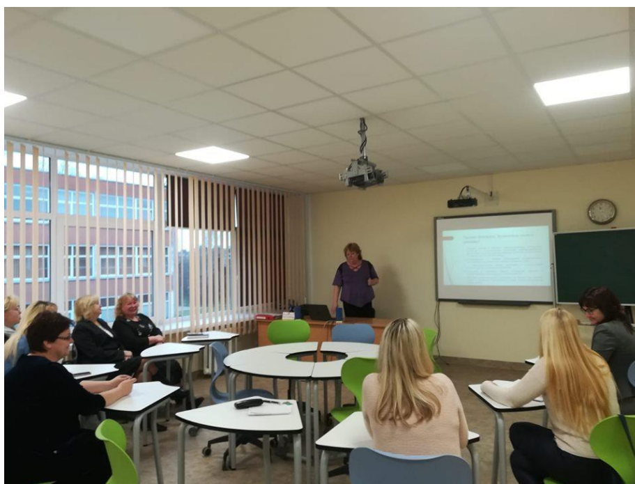
Sagatavošanas vizītes pirmā diena Klaipēdas pieaugušo ģimnāzijā

Projekta ietvaros 2020. gada janvārī notika sagatavošanas vizīte Lietuvā, kuras laikā tika saplānotas projekta aktivitātes un sasniedzamie rezultāti.